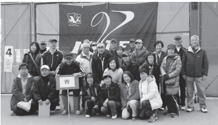
1 位 青 組