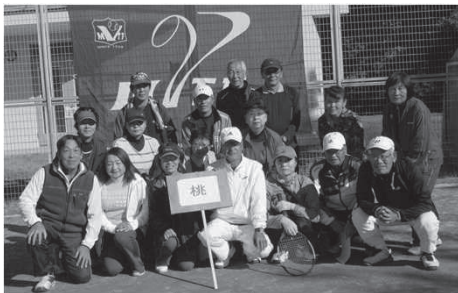
優 勝 : 桃 組