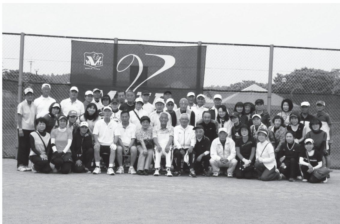
対いわきVTC親善交流大会 (2018/06/27,28: グリーンピア岩沼)