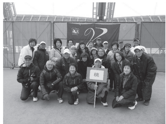
2 位 桃 組

寸 評 当日は少し肌寒い日でしたが、室内施設のため、雨・風などの影響をうけることなくテニスを楽しむことができました。 ペアリングは予め作成していましたが、当日の欠席者もいたため、ペアリング変更もありましたが、グループ内で調整して試合を進めることが出来ました。 総会の時間が延びたことで、午後の試合開始がずれたことや、大会参加者が110名越えとなり、コート2面追加の対応を行いました。試合間隔が空いた方もありました。しかし、みなさまのご協力で怪我人も無く終了できました。 今後も課題など改善して、より良い大会に繋げていきたいと思ひます。 ありがとうございました。