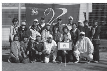
敢闘賞 ← 青 組 緑 組 →