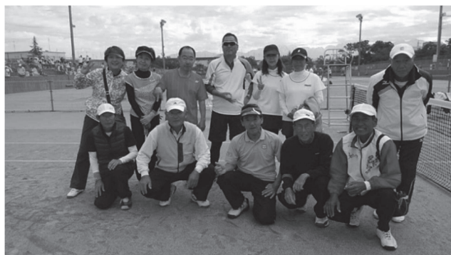
《堺市チームの皆さんと》

寒いトンネルをやっと抜け、山笑う季節になりましたね。 フキノトウのほろ苦さをしみじみ味わいます。ところでフキノトウに雄株雌株があり、花もそれぞれ違うことをご存知ですか？60 数年生きてきても知らないことがたくさん！そんなこともあり、今年是一緒する機会の無かった方とテニスをするのが目標です。