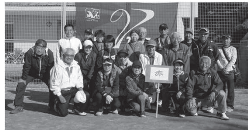
準優勝 : 赤 組