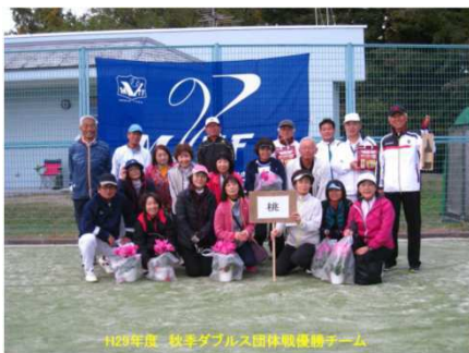
優勝 桃 組