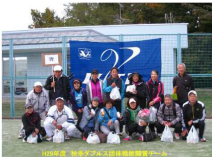
敢闘賞 青 組