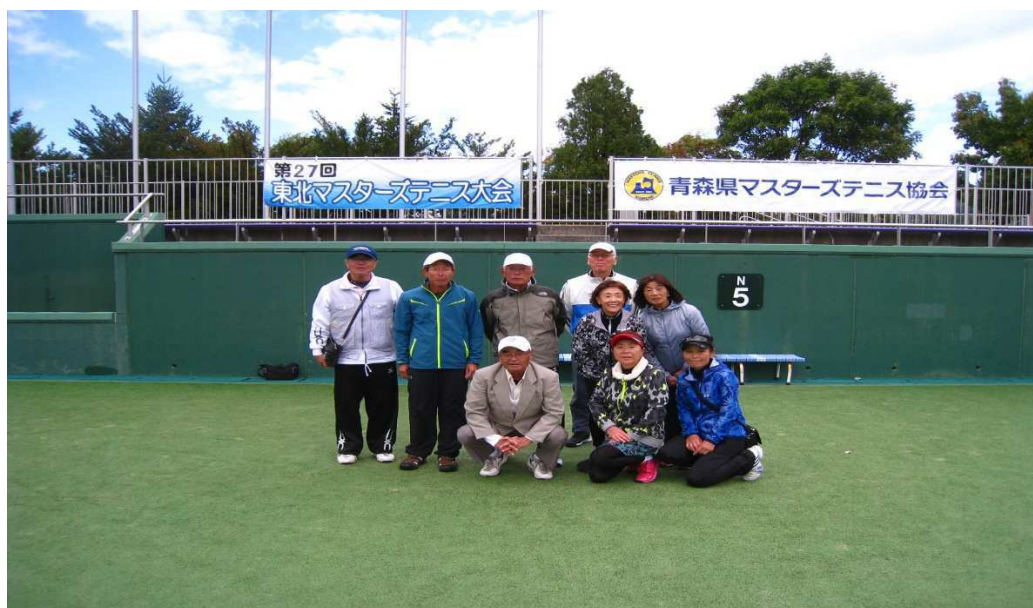
宮城からの参加者

来年は岩手県一関での開催となります。東北マスターズ大会という名称ですが、「みやぎいきいきテニス連盟」の会員は誰でも参加できる大会です。是非気軽に参加いただければ幸いです。