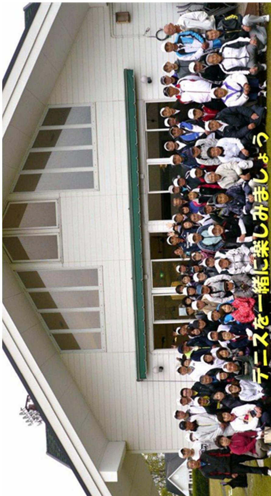
みやぎいきいきテニス連盟 [URL] http://miyagi-ikiiki-tennis.com/