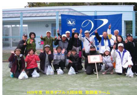
敢闘賞 赤 組