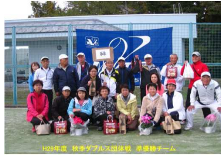
準優勝 緑 組