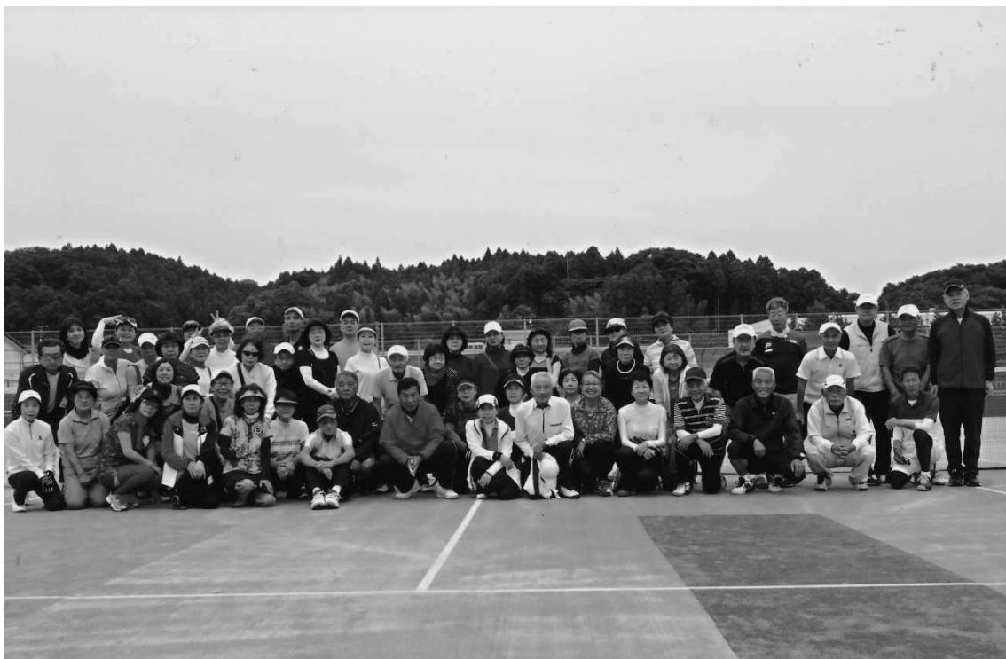
第30回 みやぎいきいきVSいわきベテラン親善交流テニス大会 平成29年 6月28日・29日

2日間に渡りいわき側の温かいおもてなしで参加者一同大満足で終わる事が出来た事、何よりでした。