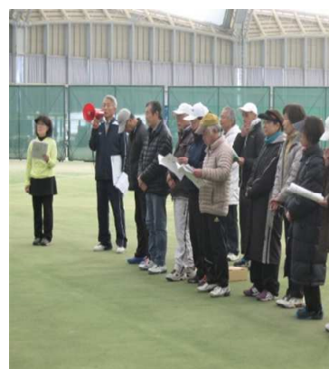
平成28年度 みやぎいきいきテニス連盟 総会風景