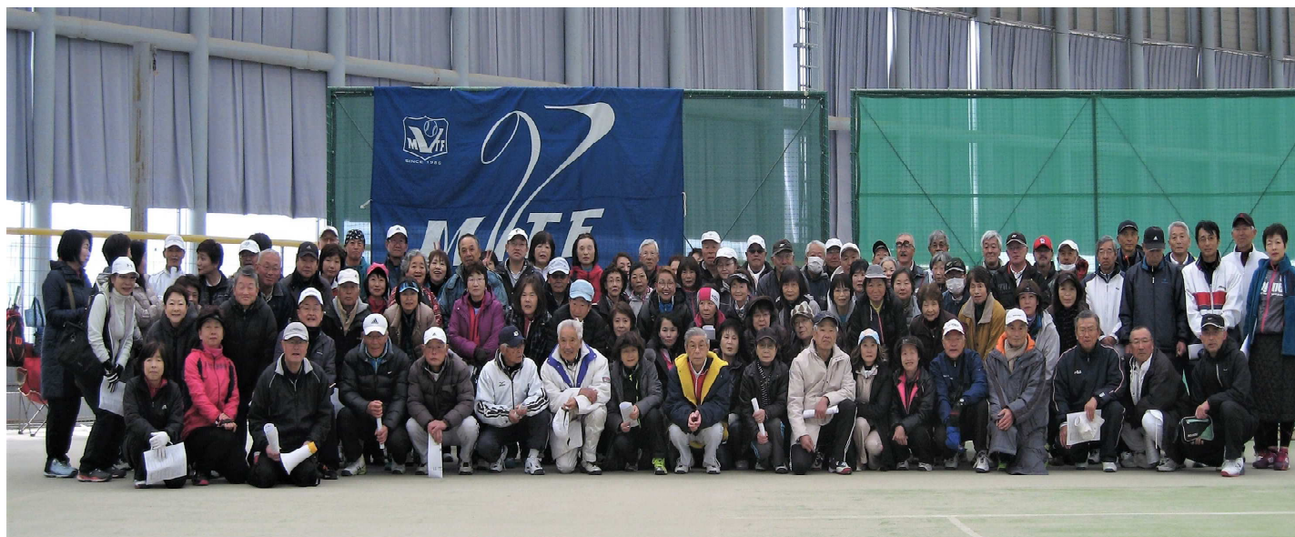
30周年記念大会 2017/3/22 シェルコムせんだい