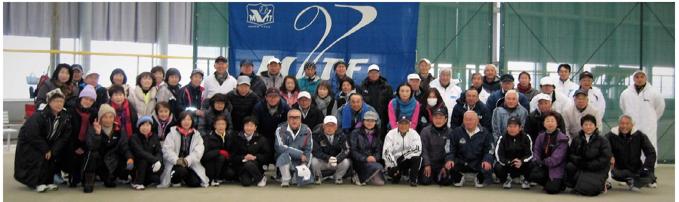
2017/2/10 年齢別室内ダブルス大会 : 参加者68名 : 於 シェルコムせんだい

****-****-****-****-****-****-****-****-****-****-****-****-****-****-****-****-****-****