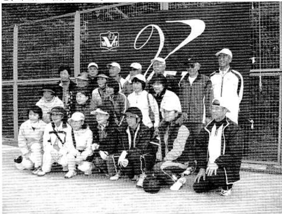
優勝：緑組の皆さん

最後に、いつもの事ながら、賞品やお楽しみ参加賞など準備された女性役員には、買い物や重〜い荷物運びなど、本当にご苦労様でした。