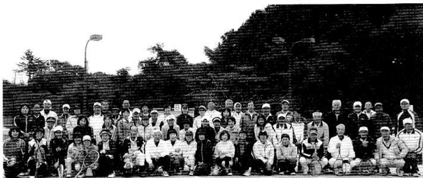
宮城いきいき連盟県北交流会記念

年々、増える参加者の対戦表作成など、いろいろご苦労もあるかと思いますが、県北の皆様方の心遣いがとても嬉しい大会でした。次回を楽しみにしつつ、テニスのレベルアップと健康維持に努力したいと思います。県北の皆様、ありがとうございました。