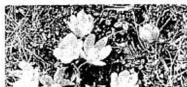
「花名」当てクイズ NO. 3